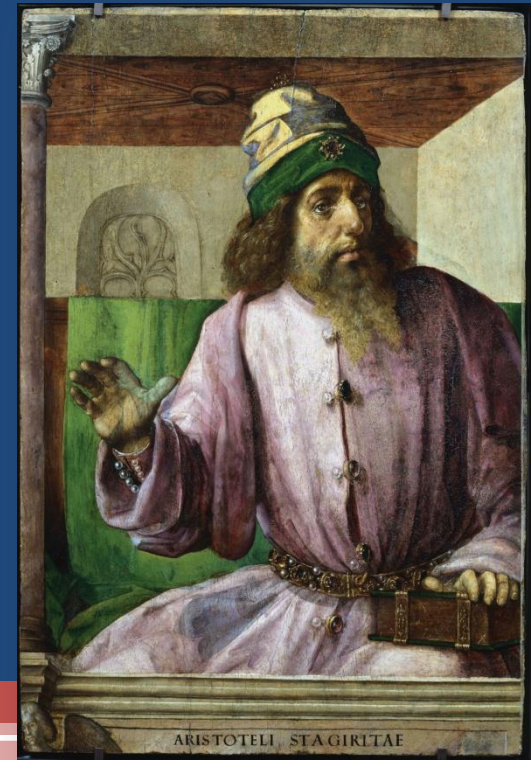
Pintura de Justo de Ghent e Pedro Berruguete (séc. XV)