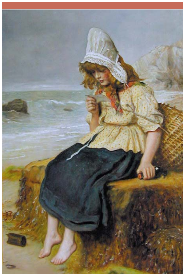
Mensagem do Mar , de John Everett Millais (1829-1896). Ao acreditar sem provas suficientes na solidez do navio, o armador seria culpado pela morte de todos os passageiros e pelo sofrimento dos seus familiares.

[...] Se me permitir acreditar em algo sem razões suficientes, pode ser que nada de grave advenha dessa crença; esta até pode revelar-se verdadeira, ou posso nunca ter a oportunidade de agir publicamente com base nela. Mas não posso evitar fazer um grande mal para com o Homem, ao tornar-me crédulo. O perigo para a sociedade não é apenas o