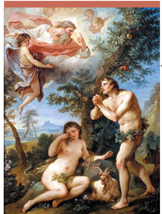
A Expulsão do Paraíso , de Charles Joseph Natoire (1700-1777) Será a possibilidade do paraíso uma exigência da vida moral?